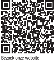
Bezoek onze website